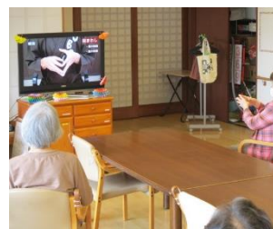
歌や脳トレも組み合わせられているので飽きません。