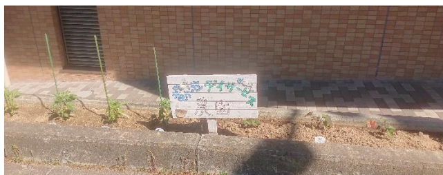
5月に撮影。どれだけ実るか今から楽しみ！

パプリカは7月に、サツマイモは10月に収穫予定です。採れた作物はおやつ作りに使用したり、持って帰って頂いたりします。