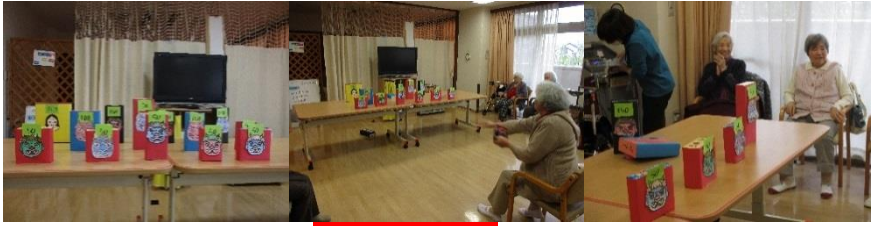
「鬼退治ゲーム」の様子

みなさん全力で鬼退治に協力してくれました！ 鬼の絵は皆さんに色塗りしてもらった物で、ゲームの準備も手伝っていただきました。