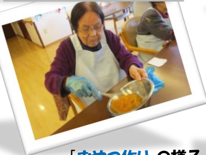
「おやつ作り」の様子