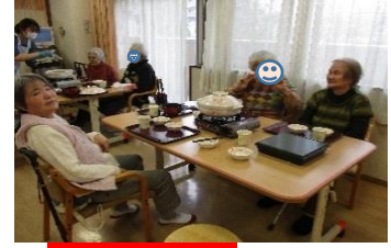
お鍋イベントの様子

みなさん全力で鬼退治に協力してくれました！ 鬼の絵は皆さんに色塗りしてもらった物で、ゲームの準備も手伝っていただきました。