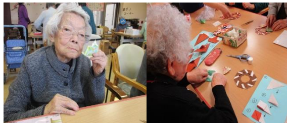
工作「ひな人形作り」の様子

懐かしい歌をハーモニカで演奏しながら歌を歌ってリフレッシュ ♪(o) / ♪♪♪