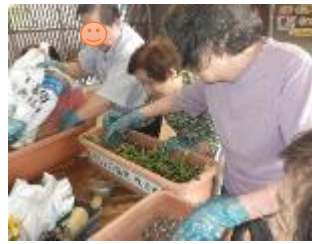
花の植え替えのお手伝いの様子