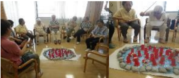
今月のゲーム「タコ釣り対決」