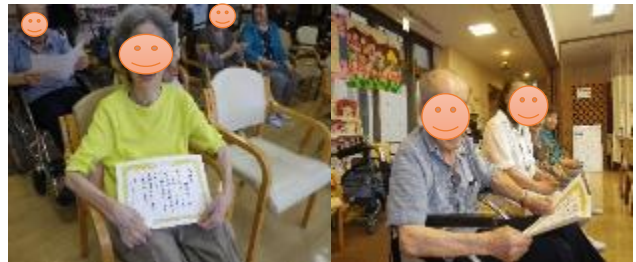
敬老会で「感謝状」をお渡しした時の様子