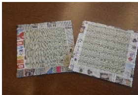
「手作りコースター」でおやつ