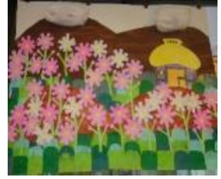
今月の壁面工作(コスモス)